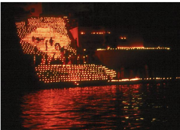
Deva Dipawali – das Lichtfest der Götter

Die Dias zeigen viele Facetten der Stadt, ihre imposanten Paläste und das tägliche Leben am Ufer des Ganges, verborgene Winkel im Gewirr der Altstadtgassen, religiöse und weltliche Festlichkeiten bei Tag und bei Nacht.