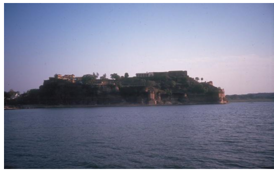
Der Ganges bei Chunar, Uttar Pradesh