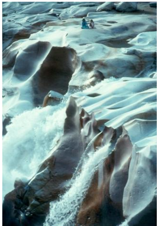
Wasserfall bei Gangotri