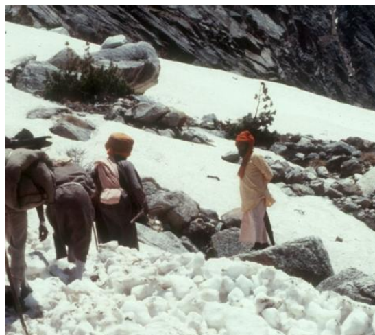
Pilger auf dem Weg zur Bhagirathi-Quelle